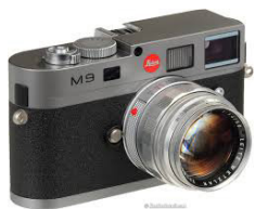
Càmera LEICA de 35 mm

La seva grandària la feia molt discreta, cosa que va afavorir el seu ús en situacions conflictives, o quan es requeria passar desapercebut. Fotògrafs i fotògrafes reconegudes com Gerda Taro, Sebastião Salgado, Diane Arbus, Cartier-Bresson, Robert Capa, o Terry O'Neill van fer de la Leica un dels seus segells d'identitat i moltes de les fotografies que han passat a la història s'han disparat amb aquestes càmeres.