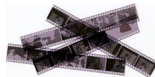
Pel·lícula de 35 mm