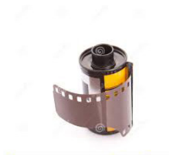
Rodet de Pel·lícula de 35 mm