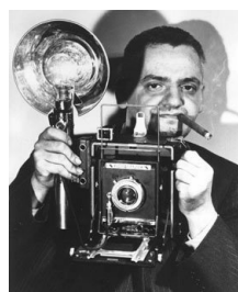
El fotògraf Weegee amb la seva càmera de plaques