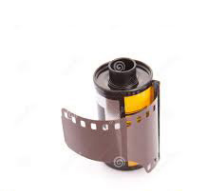
Rodet de Pel·lícula de 35 mm