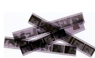
Pel·lícula de 35 mm