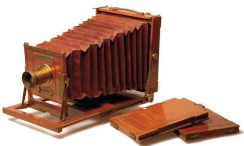
Càmera de plaques de fusta

Les primeres càmeres de gran format consistien en un cos enorme o una manxa que unia l'objectiu i el pla, on es disposaven grans plaques de fusta que després serien de metall, en les quals a dins es disposaven els vidres pintats amb una emulsió fotosensible. Tot i que van anar evolucionant i cada vegada foren més petites i assequibles, seguien essent càmeres complexes. El 1924 apareix la primera càmera de rodet i, a poc a poc, es deixarien d'utilitzar les càmeres de plaques.