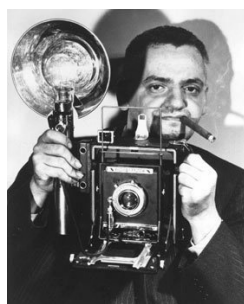
El fotògraf Weegee amb la seva càmera de plaques