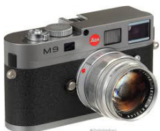
Càmera LEICA de 35 mm

La seva grandària la feia molt discreta, cosa que va afavorir el seu ús en situacions conflictives, o quan es requeria passar desapercebut. Fotògrafs i fotògrafes reconegudes com Gerda Taro, Sebastião Salgado, Diane Arbus, Cartier-Bresson, Robert Capa, o Terry O'Neill van fer de la Leica un dels seus segells d'identitat i moltes de les fotografies que han passat a la història s'han disparat amb aquestes càmeres.